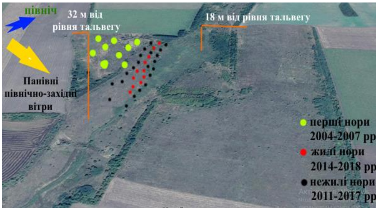
Рис. 2. Схема розташування нір байбака в поселенні та їх зміщення вниз по схилу впродовж 2004-2018 рр. [на основі 10].

Аналіз початкового розташування нір байбака в данному поселенні свідчить, що впродовж перших трьох років чисельність тварин зростала (до 32-35 осіб) і відбувалось розширення площі колоніальної площі до 150-170 м в діаметрі, спрямованої вниз по схилу. Надалі, у 2007-2008 рр. відбулось загальне переміщення розташувань жилих нір також вниз по схилу (на 120-170-200 м від первинних), майже до межі його переходу в тальвегову зону. Причинами полишення первинної зони колоніального поселення та його неухильного зміщення вниз по схилу вірогідно стало виснаження кормової бази на край посушливих малопродуктивних верхніх ділянках балкового схилу. Відсутність цілісного трав'янистого покриву в зоні первинного розташування поселення Marmota bobak зберігається до наявного часу, що добре помітно на рис. 2. Певно, що малопродуктивні кормові запаси даних стацій погіршувала і дуже короткочасна вегетація рослинності впродовж травня-червня. Несприятливі стаціонально-кормові умови для мешканців поселення спричиняли необхідність подовжених кормових маршрутів до нижніх ділянок схилу і тальвегової зони, де вегетуюча рослинність зберігалась практично до середини листопада. При цьому віддаленість кормових стацій від центральної зони поселення обмежувала рівень колективної сторожкості байбаків, підвищуючи загрозу потрапляння під атаку повітряних і наземних хижаків. Останні, користуючись західними вітрами (від поселення), могли легко могли підкрастись до байбаків під час годівлі на підвітряному схилі.