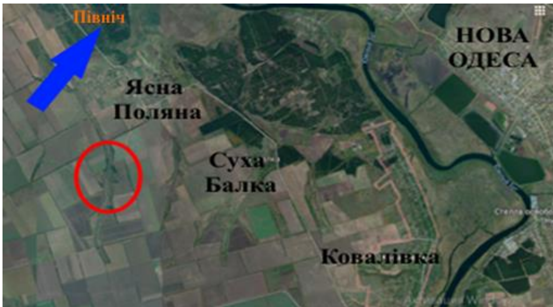
Рис. 1. Розташування поселення байбака на північній межі Сухого Степу в зоні верхньої тераси долини П.Бугу [на основі 10].

На відміну від лісостепового, південно-степове байбака поселення поблизу села Ясна Поляна Миколаївського району було створене в 2004 році шляхом випуску 24 особин, у тому числі 9 дорослих самок, 5 дорослих самців та 10 молодих тварин річного віку (6 самок і 4 самця). Дата випуску – 24 червня 2004 року. Тварин для інтродукції було відловлено в Старобільському районі Луганської області, піддано перетримці (14 діб) та транспортовано до місця випуску. Безпосереднім місцем випуску інтродуцентів у 2004 році була обрана балка, яка розташована на південний захід від села Ясна Поляна (рис. 1), схили якої зберігали цілинно-степовий характер біотопів і були розташовані впоперек пануючих західних вітрів. Через віддаленість балки від населених пунктів, випас свійських тварин у місці планованого під поселення байбака не проводився, а належність угідь до земель Лісового фонду забезпечувала їх дієву охорону.