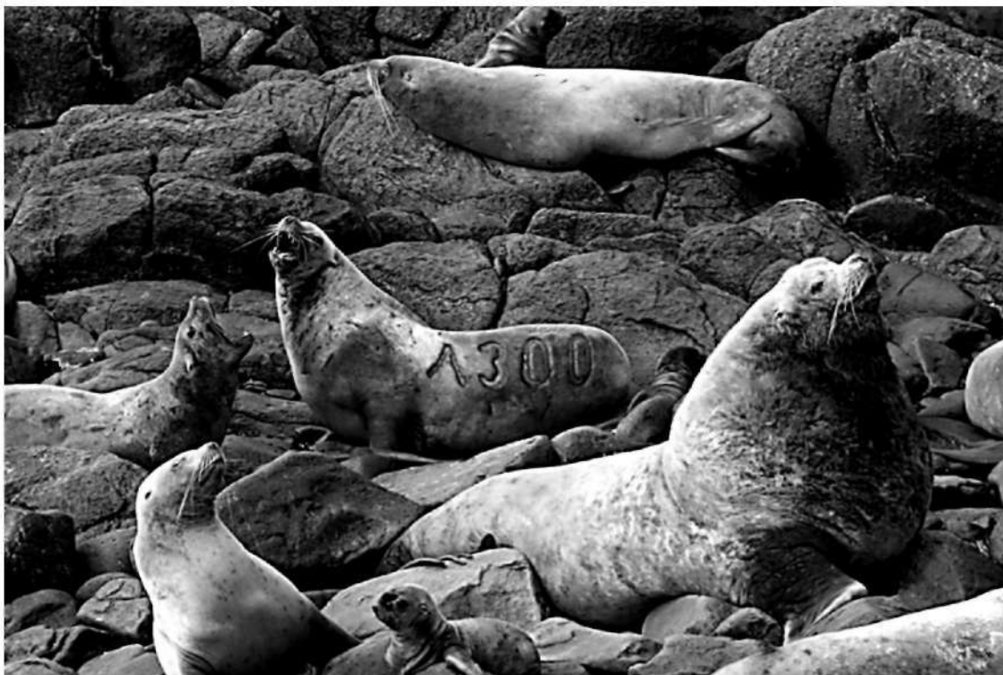
Рис. 1. Территориальный самец сивуча с самками на лежбище ск. Долгая, о-ва Каменные Ловушки.

Наблюдения за лежбищем выполняли ежедневно, с 6 июня по 13 июля 2009 г., в течение светлого времени суток. Два наблюдателя начинали работу около 6:00 и заканчивали около 23:00 с перерывами на обед и отдых. Общее время наблюдений непосредственно на лежбище составило 555 часов. Визуальные учёты сивуча выполняли ежедневно один раз в середине дня. Подсчет животных производили на отдельных участках лежбища с дифференциацией учитываемых животных по поло-возрастным категориям, в соответствии с принятой методикой [2; 3; 5; 7]. Всего за сезон выполнено 33 учета. Помимо этого, осуществляли поиск меченых и приметных сивучей (рис. 1) и наблюдали за ними. При помощи цифровой фотосъёмки документировали присутствие сивучей на лежбище, фотографировали травмы или иные естественные маркеры имеющиеся у животных, подтверждали репродуктивный статус в текущем сезоне (роды, спаривание, выкармливание детеныша, наличие индивидуальных территорий и самок у взрослых самцов и т.д.). Следили за появлением на лежбище погибших сивучей, старались определить причины их гибели. Все работы проводили дистанционно, из укрытий с возвышенной точки берега, снижая, таким образом, уровень беспокойства животных до минимума.