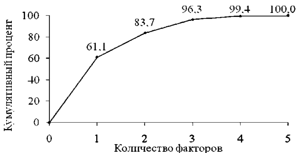
Рис. 2. Суммарная значимость влияющих факторов.

На рис. 2 изображена зависимость кумулятивного процента общей дисперсии от количества факторов.