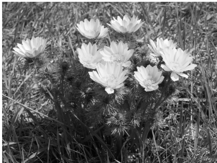
Рис. 1. Внешний вид куста Adonis vernalis L.

цельные, с заострённой верхушкой и незначительными зубцами по краю, расположены горизонтально по отношению к центральной оси, в числе 16-18. Окраска лепестков золотисто-желтая, поверхность глянцевая, с неглубокими узкими бороздками.