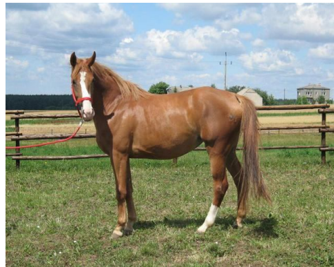
Рис. 1. Кобили арабської чистокровної (А) та великопольської порід (Б).